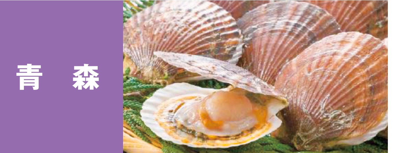
青森 陸奥湾ほたて、津軽海峡メバル 深浦マグロ、青森のモスク 青森ひらめ、十三湖産ヤマトシジミ 青森のホッキガイ(ウバガイ)