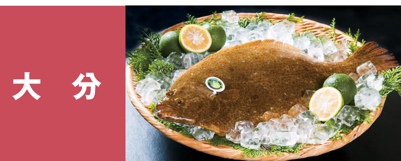
大分 かぼすヒラメ 銀たち「くにさぎ銀たち」「白袴たちうお」 大分ヒラメサ 落ちハモ、豊後別府湾ちりめん かぼすブリ