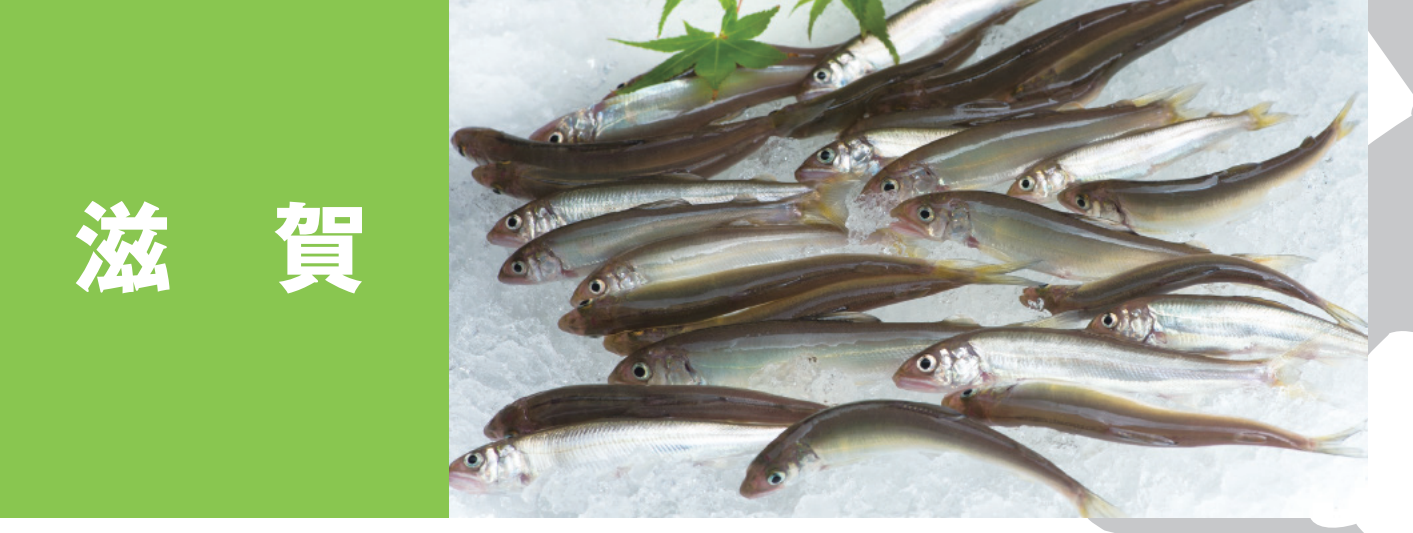
滋賀 コアユ ピワマス フナ