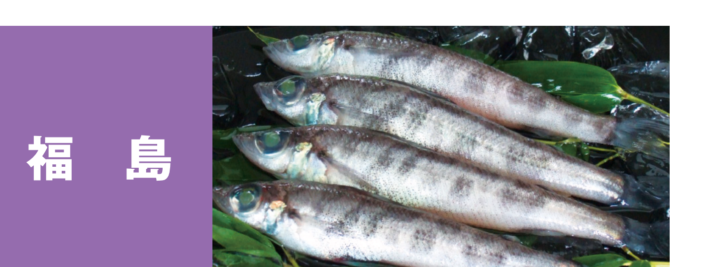
福島 小名浜のカツオ 小名浜の秋刀魚 メヒカリ