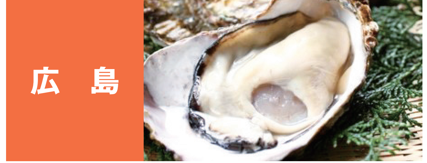
広島 広島桜ダイ、広島手掘りあさり 広島の小イワシ、三原やっさタコ 広島銀太刀、チヌ(クロダイ) 広島かき、広島の水タリガニ