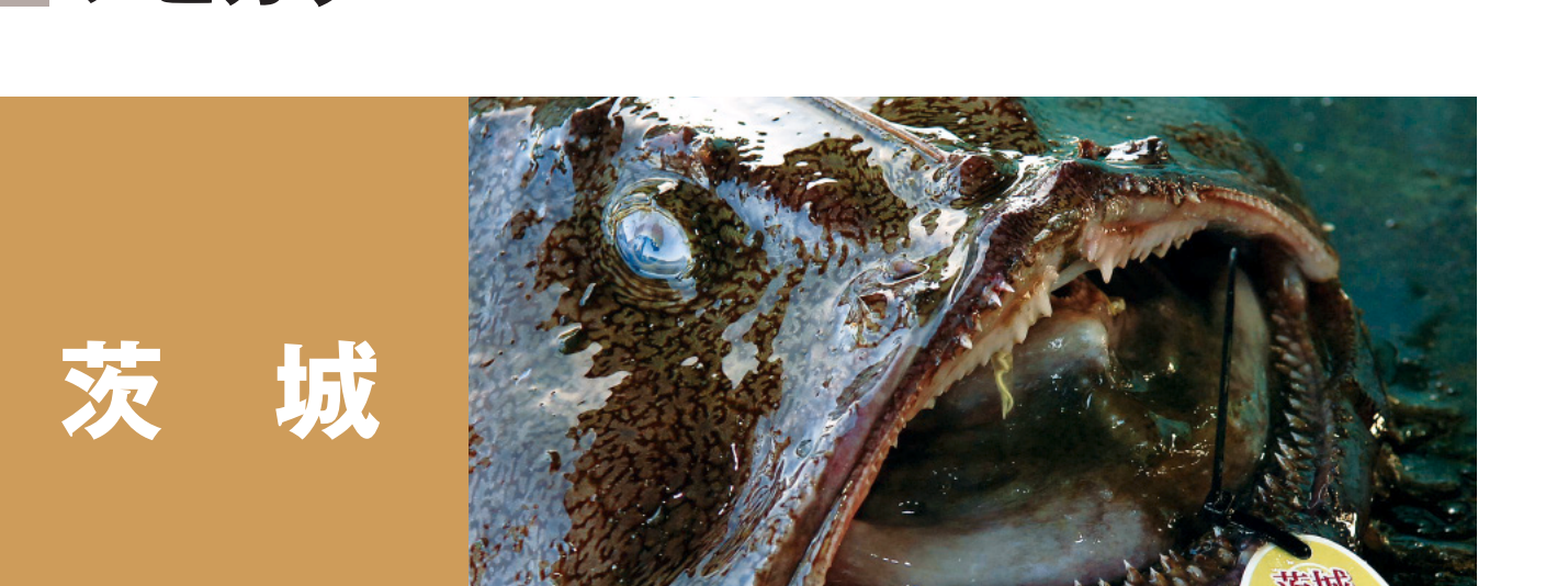
茨城 鹿島灘はまぐり、茨城のこうなご 茨城のあわび 茨城のひらめ、茨城のしらす 茨城あんこう、茨城常盤のまさば