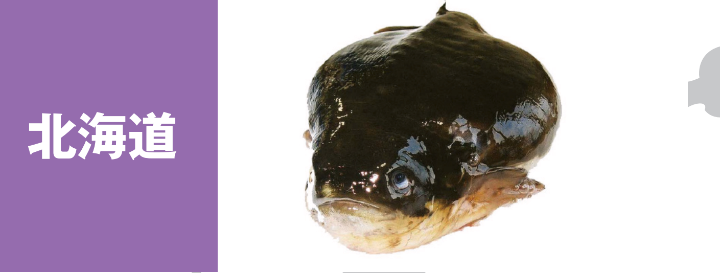
北海道 北海道の時鮭、石狩湾のニシン 日高の真つぶ 厚岸のかき、日本海の甘えび 苫小牧のほっき 小樽・石狩のしゃこ 北海道太平洋沿岸のししゃも 太平洋沿岸のまつかわがれい 函館のごっこ(ホテイウオ) 日本海・噴火湾のほたて 稚内・留萌の銀杏草