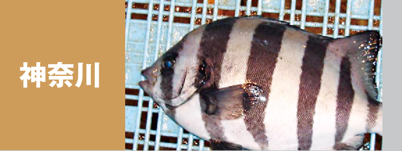
神奈川 小田原のアジ、湘南しらす 湘南はまぐり 小柴のアナゴ 佐島の地ダコ、平塚のシイラ 松輪サバ、江の島カマス(アカカマス) 小田原のイシダイ 横須賀市東部漁協のワカメ