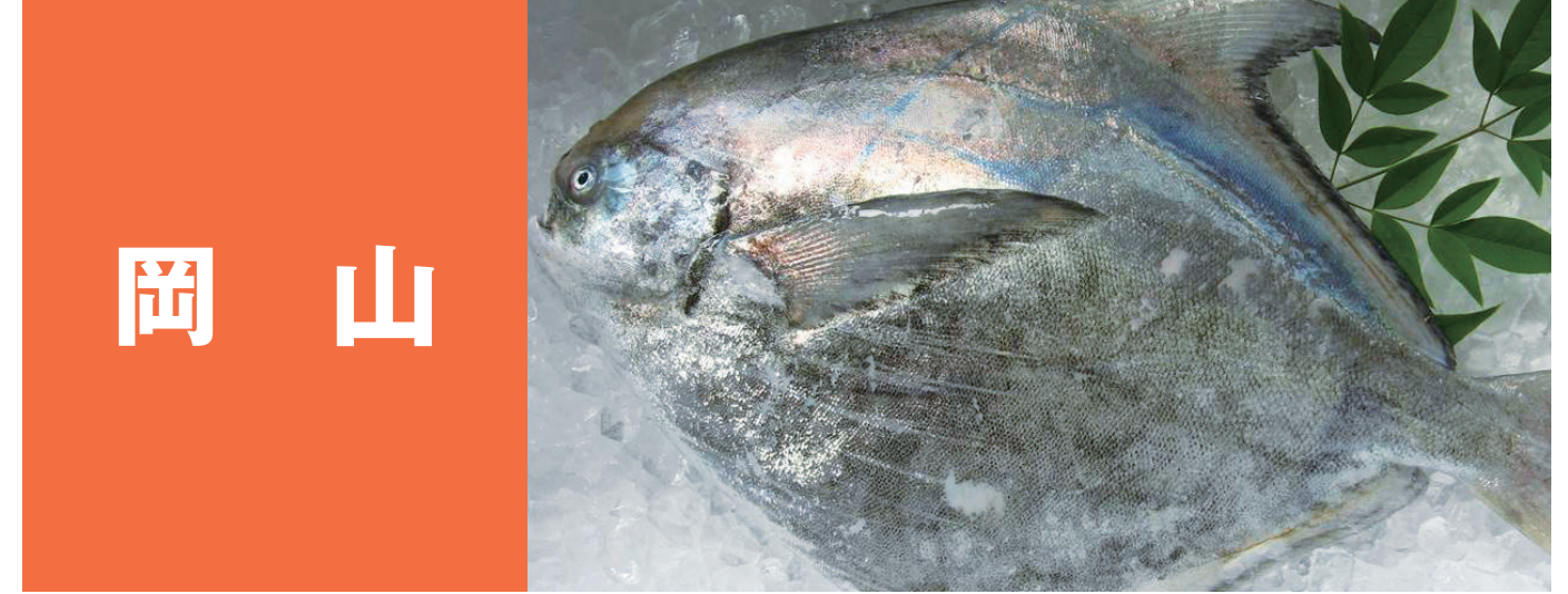
岡山 下津井のとらふぐ(おおぶく)白子持ち ひら、朝干(あさび)のさわら 流瀬のかつお(まながつお) 夏ハネ(スズキ)、岡山のアナゴ わたりがに(がざみ) 分限者のエビ・よしえび(おおぞうえび) ままかり(ざっぱ) げた(舌平目)、岡山かき ほんに良い味岡山海苔