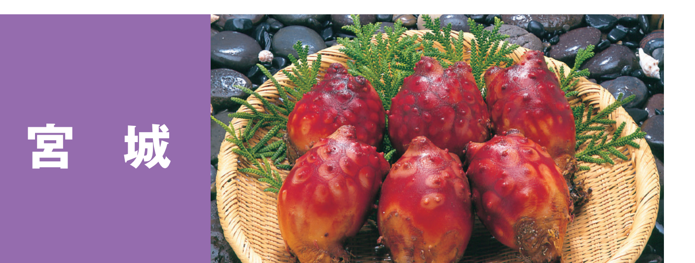
宮城 みやぎサーモン、みやぎのワカメ 表浜アナゴ、ホヤ(マボヤ) みやぎの殻付カキ