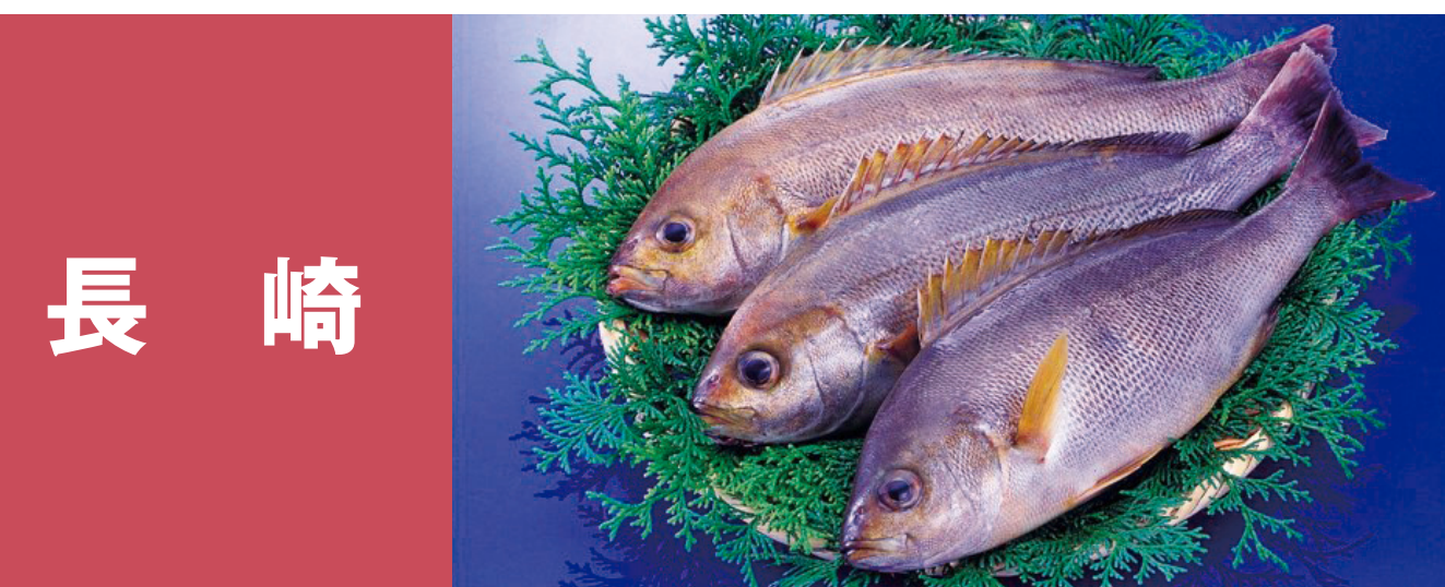
長崎 真あじ(ごんあじ・野母んあじ) 長崎のイサキ 長崎とらふぐ(養殖トラフグ) 長崎の養殖クロマグロ