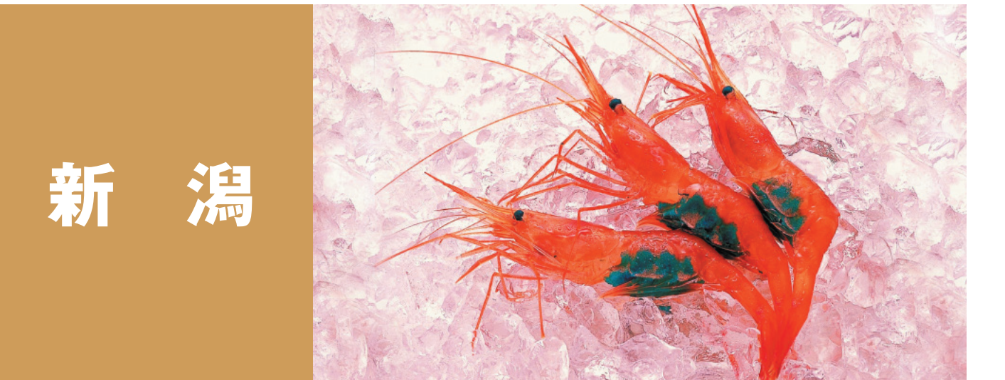
新潟 佐渡のナガモ(アカモク) 新潟のノドグロ(アカムツ) 越後の柳カレイ 南蛮エビ、佐渡の寒ブリ、越後本ズワイ