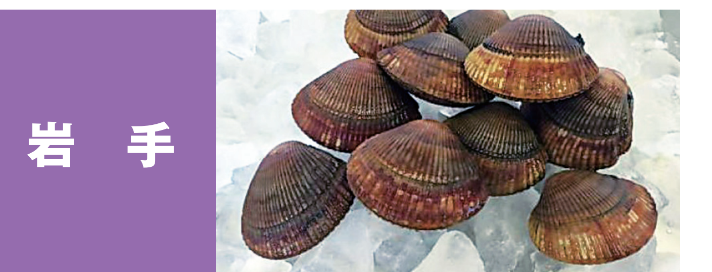
岩手 岩手のわかめ 陸前高田のエゾイシカゲ貝 岩手の秋さけ(いくら) 岩手のあわび