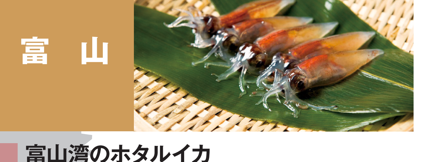
富山 富山湾のホタルイカ 富山湾のスルメイカ(花見イカ) 富山湾のマイワシ 富山湾のシロエビ 富山湾のバイ貝(ツバ貝、オオエツチュウバイ) 富山湾のイワガキ 富山湾の紅ズワイガニ 富山湾のカマス 富山湾のフクラギ 富山湾のブリ、富山湾のゲンゲ 富山湾のウマヅラハギ