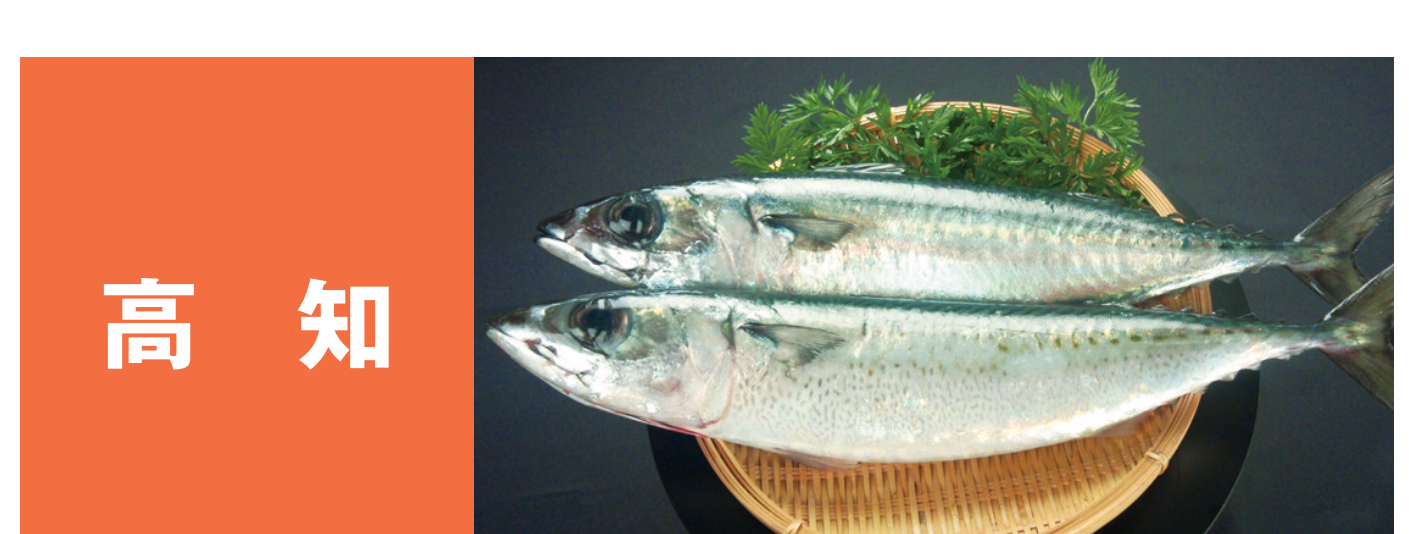
高知 土佐さが日戻り鯉 土佐沖どれキンメダイ 宇佐の一本釣りウルメ 高知春野の「どろめ」 土佐の清水さば 定置獲れたて室戸ブリ