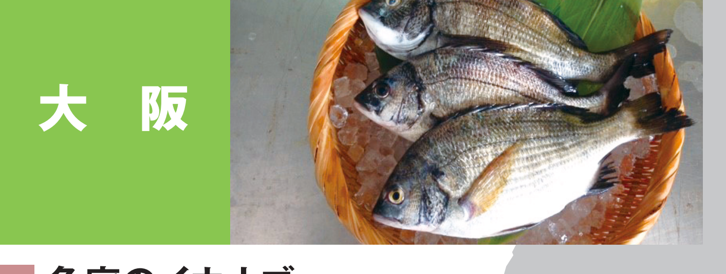
大阪 魚庭のイカナゴ 大阪のイワシシラス 大阪のマアナゴ 魚庭のマダコ、大阪のマイワシ 大阪のスズキ 魚庭のサワラ 岸和田祭りのわたりがに(ガザミ) 大阪のマルアジ 魚庭のアカシタ(イヌノシタ) 茅渚の海のクロダイ 大阪のマダイ