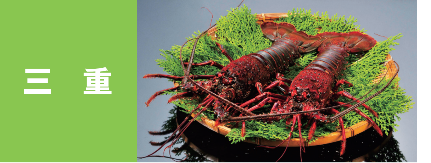
三重 三重の天然ブリ 三重の海女獲りあわび 伊勢えび、伊勢まだい あおさのり、三重の養殖マハタ 伊勢あさくさ海苔*、伊勢まぐろ