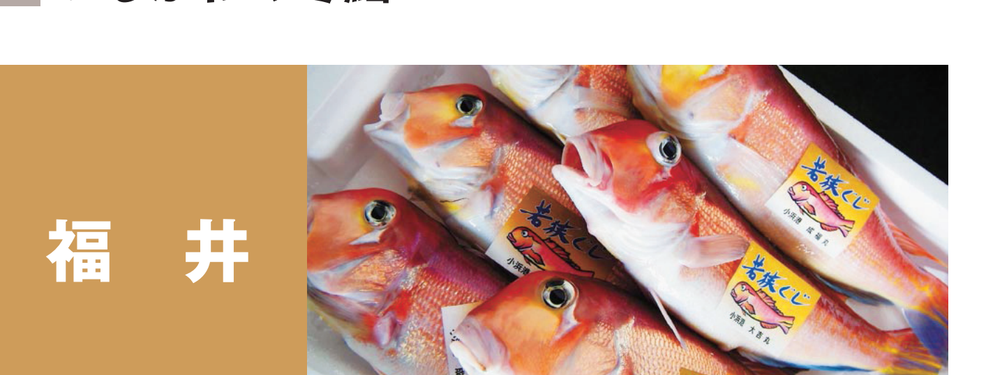
福井 ふくい甘えび、福井のホタルイカ ふくいサーモン 福井のトビウオ、福井のシイラ、若狭くじ 若狭のアオリイカ、福井のさわら 越前がれい 若狭ふぐ、若狭の寒ブリ、越前がに