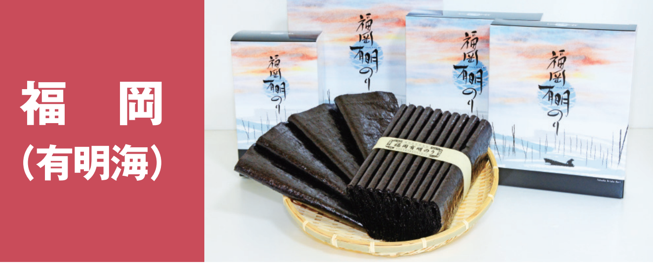
福岡(有明海) 福岡有明のり(有明海産 一番摘み)