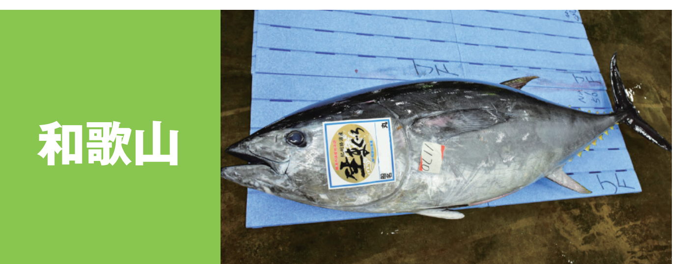
和歌山 ケンケン釣りカツオ 銀鱗の太刀 和歌山県産しらす 和歌山県産イセエビ 紀州勝浦産まぐろ