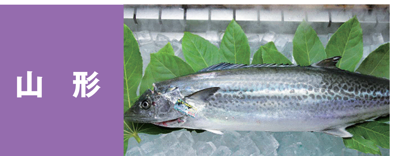
山形 庄内浜もずく 庄内おぼこサワラ、庄内秋のサケ 紅えび