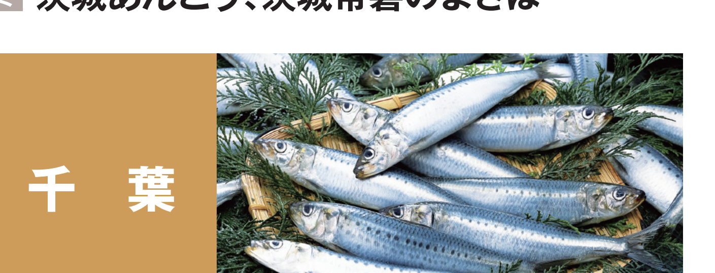
千葉 初カツオ、千葉のつりきんめ、 千葉のハマグリ、東京湾のホンビノス貝 銚子の入梅いわし、船橋の瞬めスズキ 千葉のアワビ 千葉のイセエビ 江戸前千葉海苔、房総湾のマカジキ 銚子沖のホウボウ