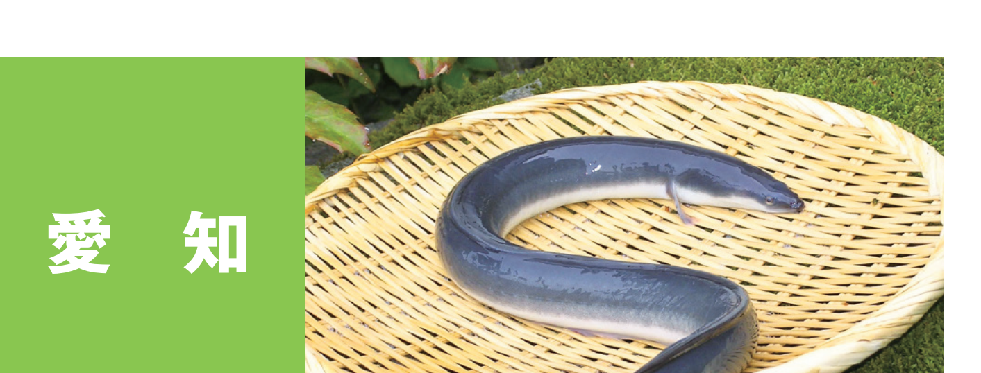
愛知 愛知のコウナゴ、あいちあさり 愛知のシラス、愛知のウナギ 愛知のスズキ、愛知のガザミ 愛知のトラフグ、愛知ノリ