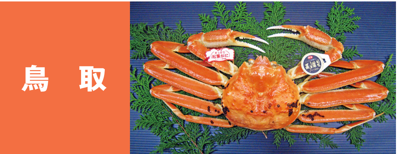
鳥取 鳥取のハタハタ 夏鱧(天然の岩ガキ) 鳥取のサワラ 松葉がに(スワイガニ)