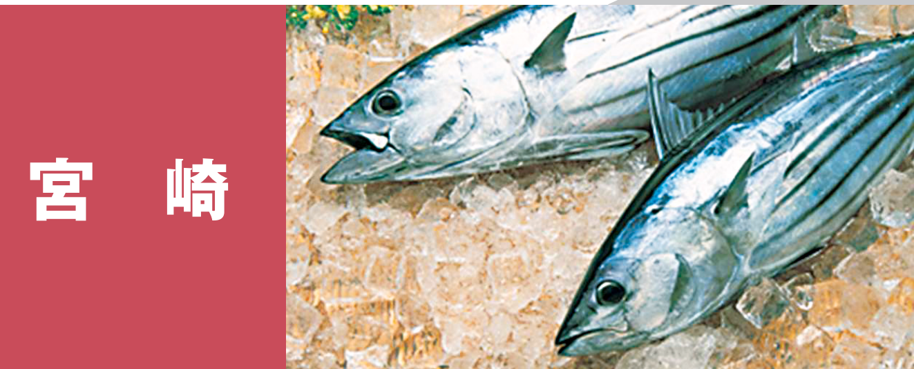
宮崎 日南のかつお、宮崎近海生マグロ 宮崎メヒカリ(アオメソ) 宮崎ちりめん、マヒマヒ(シイラ) 宮崎イセエビ e-かんばち