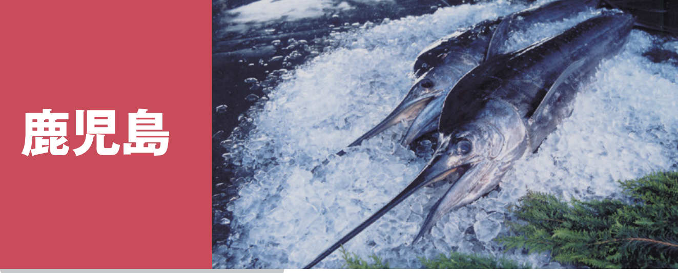
鹿児島 トッピー(トビウオ)、かごしま一本釣りかつお キビナゴ 秋太郎(バショウカジキ) タルメ(メダイ)