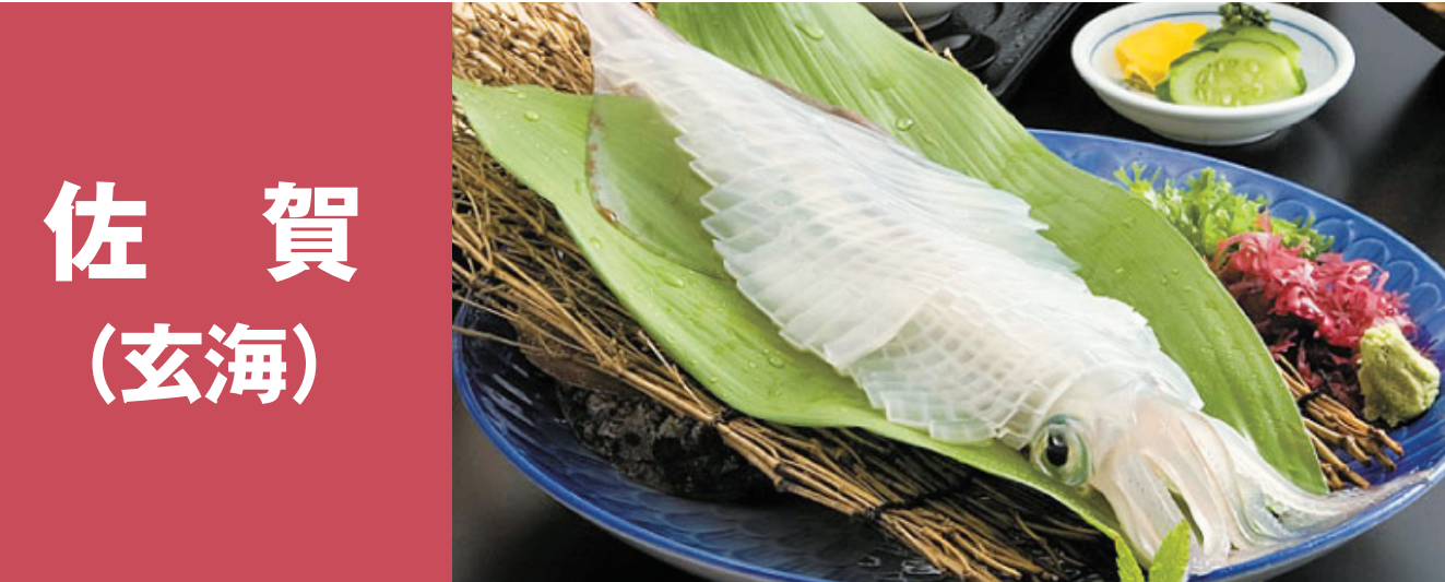
佐賀(玄海) 玄界灘の桜鯛(マダイ) 呼子のイカ(ケンサキイカ) 唐津の赤うに(アカウニ) 唐津Qサバ