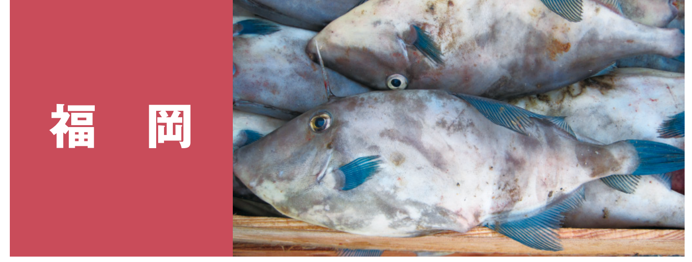
福岡 メンボ(ウマヅラハギ) 筑前海の天然マダイ 一本槍(釣ヤリイカ/ ケンサキイカ・ヤリイカ) カナトフグ(シロサバフグ) 筑前海の真かき