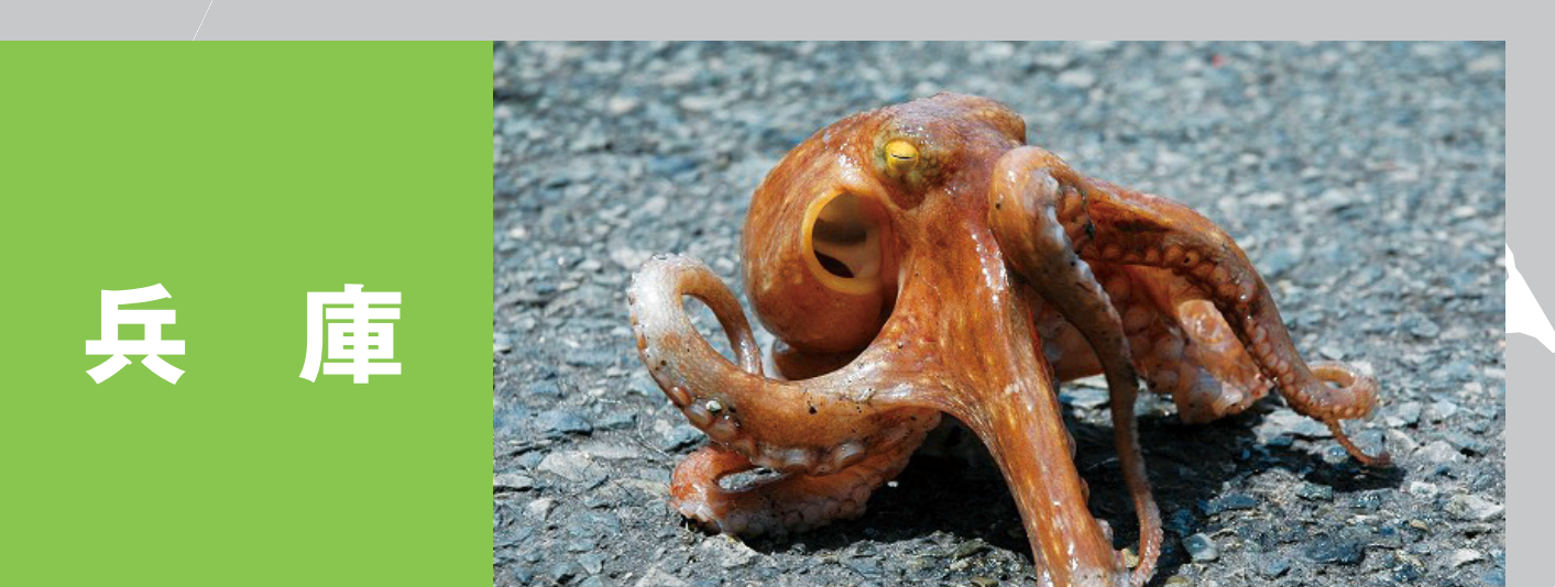
兵庫 浜坂産ホタルイカ「浜はたる」 兵庫県瀬戸内海のイカナゴ 兵庫のハタハタ 淡路島の生しらす、明石だこ 兵庫 瀬戸内の鱧 明石浦のもみじ鯛 淡路島のサワラ 香住ガニ 播磨灘産 1年牡蠣 兵庫のり 兵庫の赤ガレイ