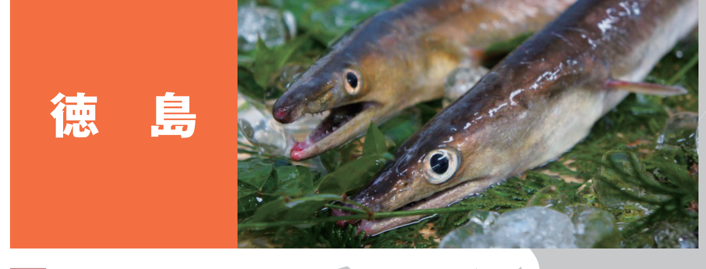
徳島 鳴門鯛、鳴門わかめ、阿波とくしまのちりめん とくしまのはも、県南のアワビ類 阿波とくしまのアオリイカ とくしまのボウゼ とくしまのスジアオノリ、とくしまのクロノリ 阿波とくしまのアシアカエビ