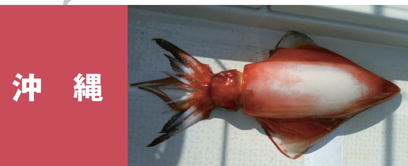
沖縄 沖縄モスク 沖縄美ら海まぐろ「キハダマグロ」 沖縄県産車海老 せーいか(ソデイカ) 沖縄美ら海まぐろ「ピンチョウマグロ(トンボ)」 沖縄美ら海まぐろ「メバチマグロ」 沖縄海ぶどう(クビレスタ)