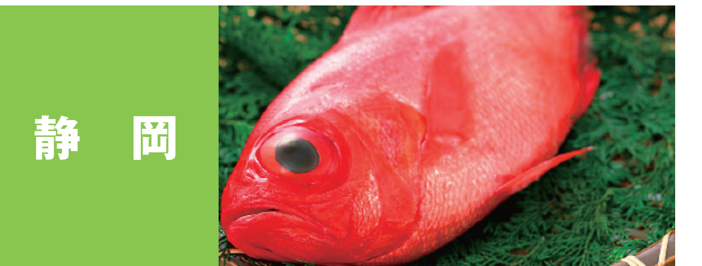
静岡 浜名湖のあさり、伊豆のさざえ、 駿河湾さくらえび 静岡のしらす、紅富士(あかふじ) 仁科の真イカ 仁科のヤリイカ、駿河湾の本えび 伊豆の地きんめ、波乗り鱈