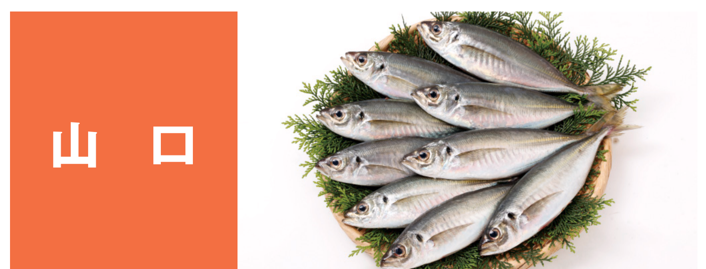
山口 瀬付きあじ、萩のまふぐ 西京はも、山口のまだこ ケンサキイカ、山口ののどぐろ とらふぐ、山口のあまだい