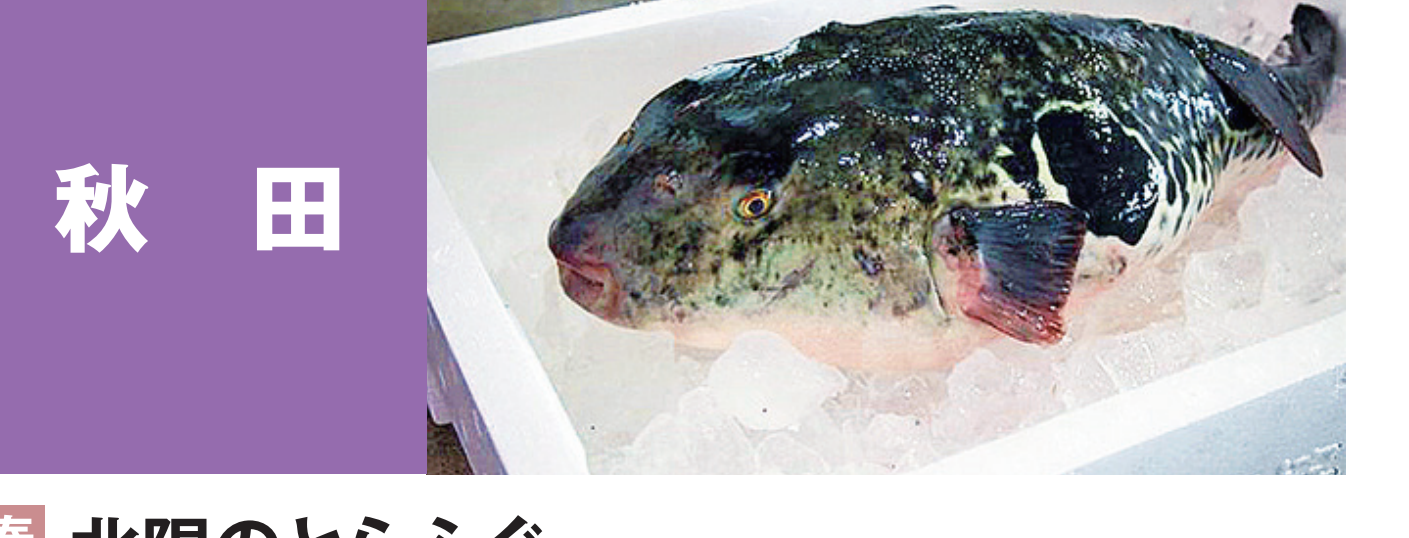
秋田 北限のとらふぐ 秋田ハタハタ、にかほずわい