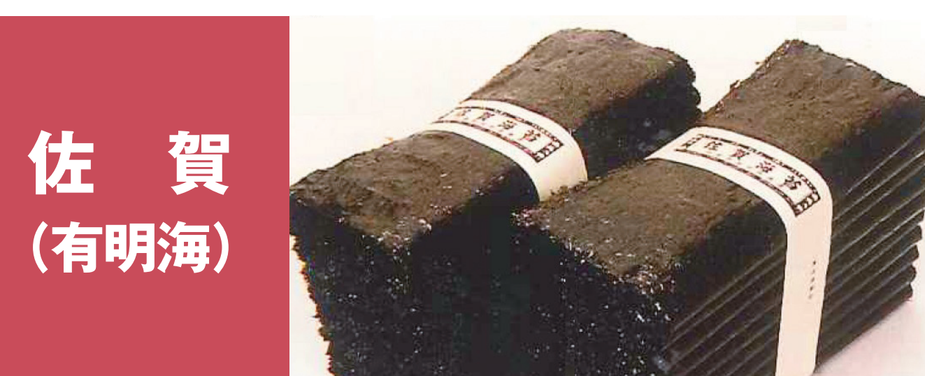
佐賀(有明海) 佐賀海苔*有明海一番