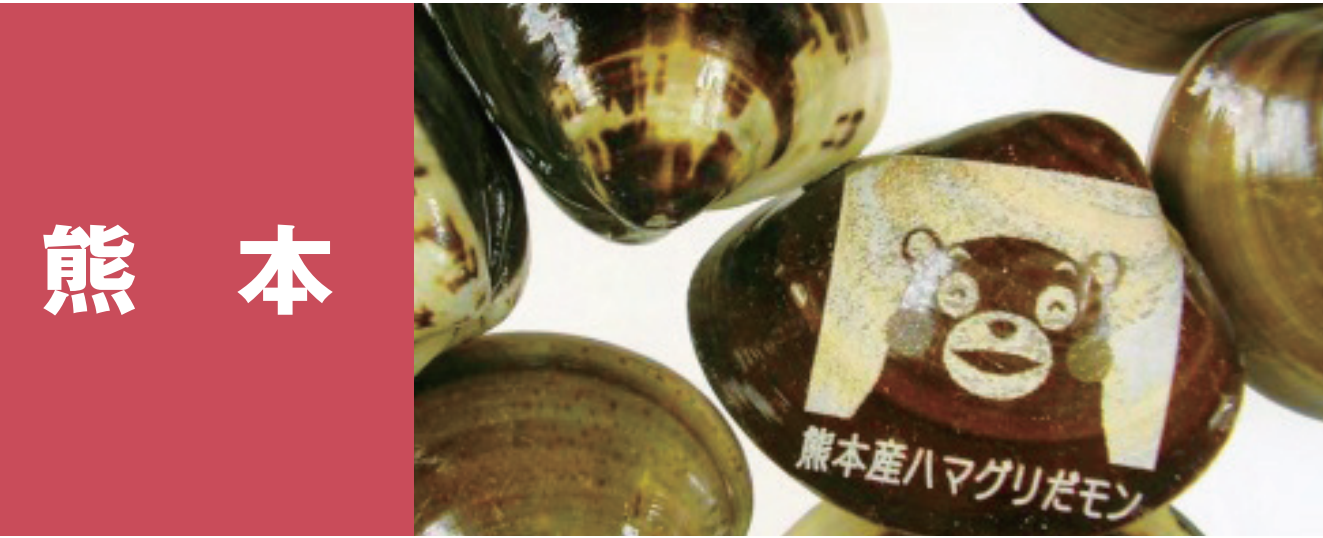
熊本 熊本アサリ 川口産大和蛤 熊本のり