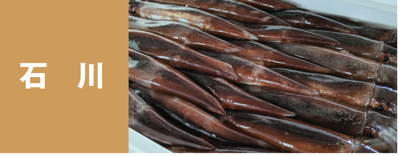
石川 いしかわのアカガレイ、いしかわのマダイ いしかわの柳八目 いしかわの生スルメイカ いしかわの岩がき、いしかわの紅ズワイ いしかわの甘えび、いしかわのノドグロ いしかわのサワラ 加能ガニ、天然能登寒ぶり いしかわの寒鱈