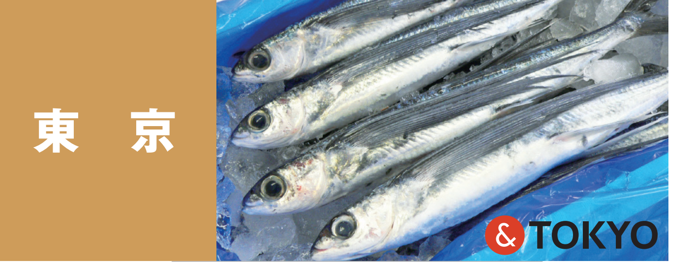
東京 八丈春とび、東京(大島)のトコブシ