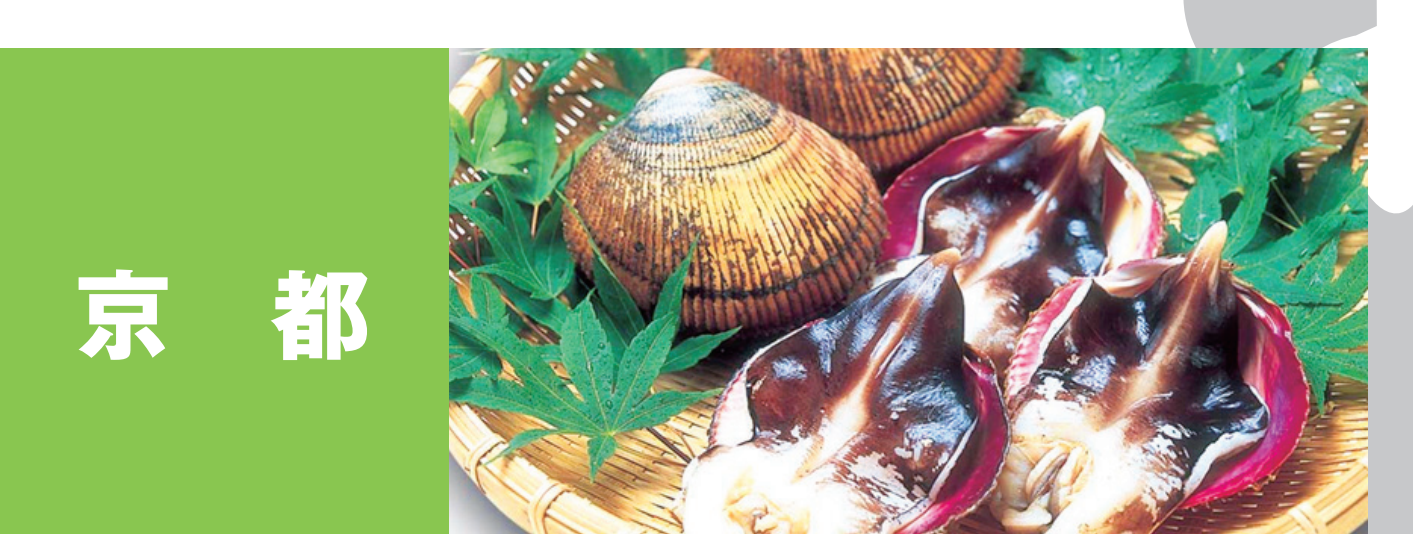
京都 活ガ京のあかがれい 丹後とり貝、丹後の海育成岩がき 丹後くじ、京鯖 京のずわいがに、京の寒ぶり