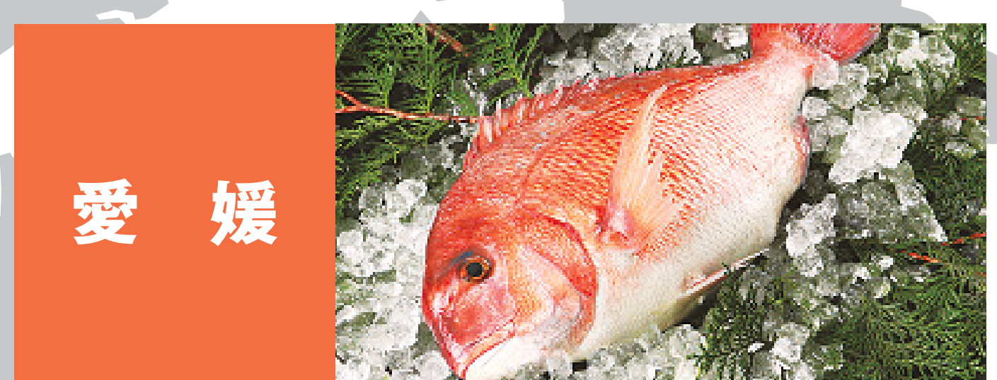
愛媛 びやびやかつお 愛育フィッシュ愛鯛 来島海峡のアコウ(キジハタ) 松山沖のマダコ 釣りタチウオ、燧灘のガザミ 愛育フィッシュ戸島一番ブリ 愛育フィッシュマハタ